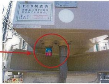
白相結露防止器取付け状態