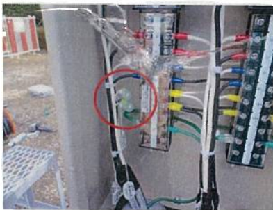
白相ヒータ電源切離し箇所 (交流200[V])