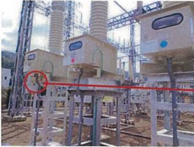
66kV1号BPD外観 (左から白相、赤相、青相)