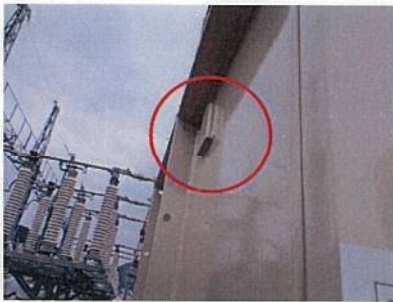
白相通気口閉鎖状況:2箇所(シリコンにて閉鎖実施)