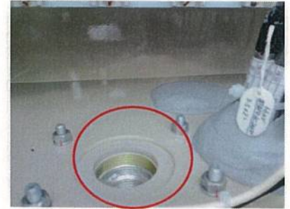
結露防止器取付け状態 (白相内部)