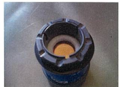
結露防止器外観 (左から全体、下部、上部)